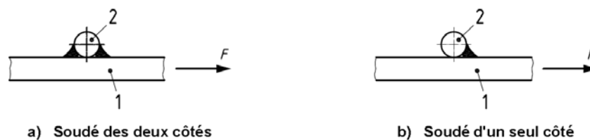
Figure 2 — Assemblage en croix soudé avec les procédés 111, 114, 135, 136 et 138

Si plusieurs barres transversales sont utilisées sur le même côté de la barre longitudinale, l'écartement des barres transversales doit représenter au moins trois fois le diamètre nominal de la barre transversale.